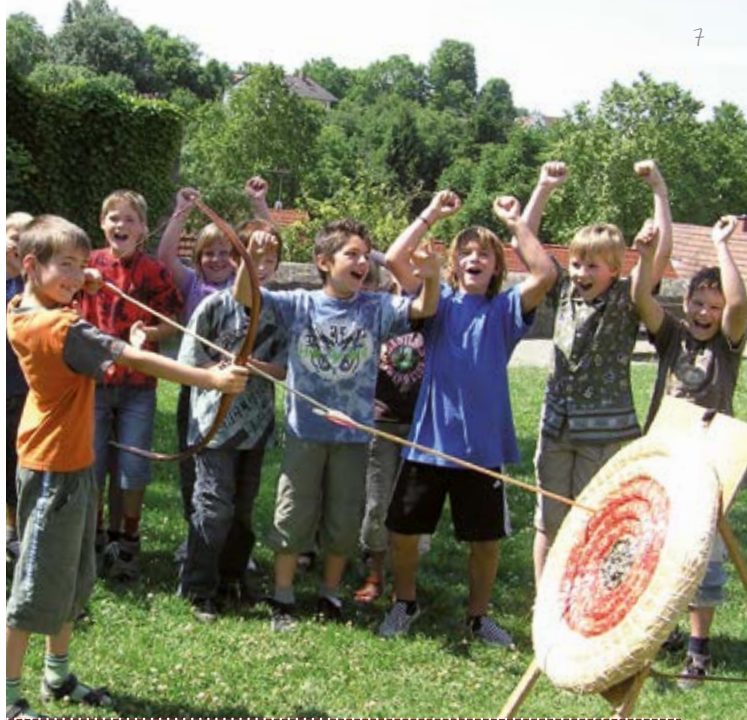
Mittelalterliche Spiele in der Stauferpfalz Bad Wimpfen

ganztätig buchbar bis 30 Teilnehmer 75,00 €