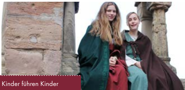
Kinder führen Kinder