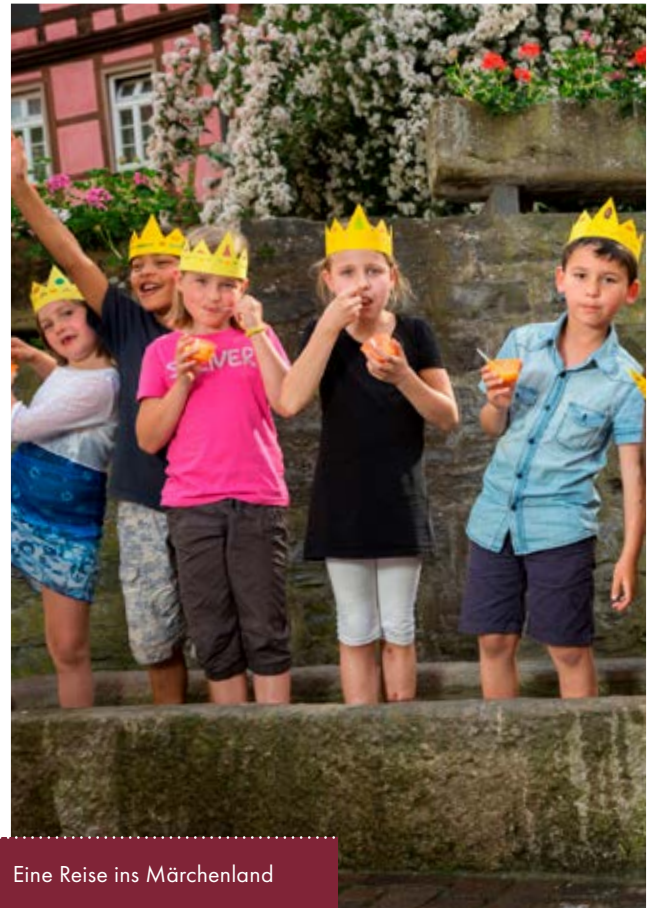
Eine Reise ins Märchenland

Gerne beraten wir Sie bei der Auswahl Ihrer Programme und erstellen für Ihren Landschulheimaufenthalt auch ein mehrtägiges Programm.