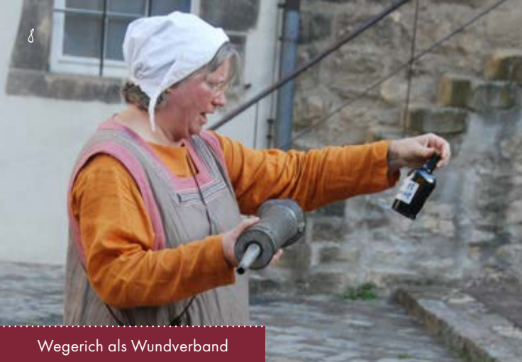
Wegerich als Wundverband