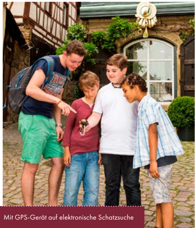
Mit GPS-Gerät auf elektronische Schatzsuche