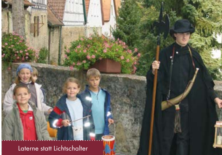
Laterne statt Lichtschalter

Individuell und ganzjährig buchbar bis 30 Teilnehmer Führung im historischen Gewand 75,00 €