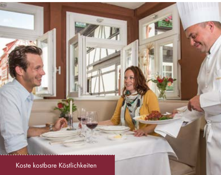
Koste kostbare Köstlichkeiten